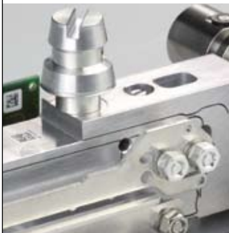
Прецизионные весы MS NewClassic.

Весовая ячейка MonoBloc – проверенная временем весовая ячейка, гарантирующая получение быстрого и точного результата. Надежный и точный датчик веса с системой защиты от ударных и скручивающих нагрузок.