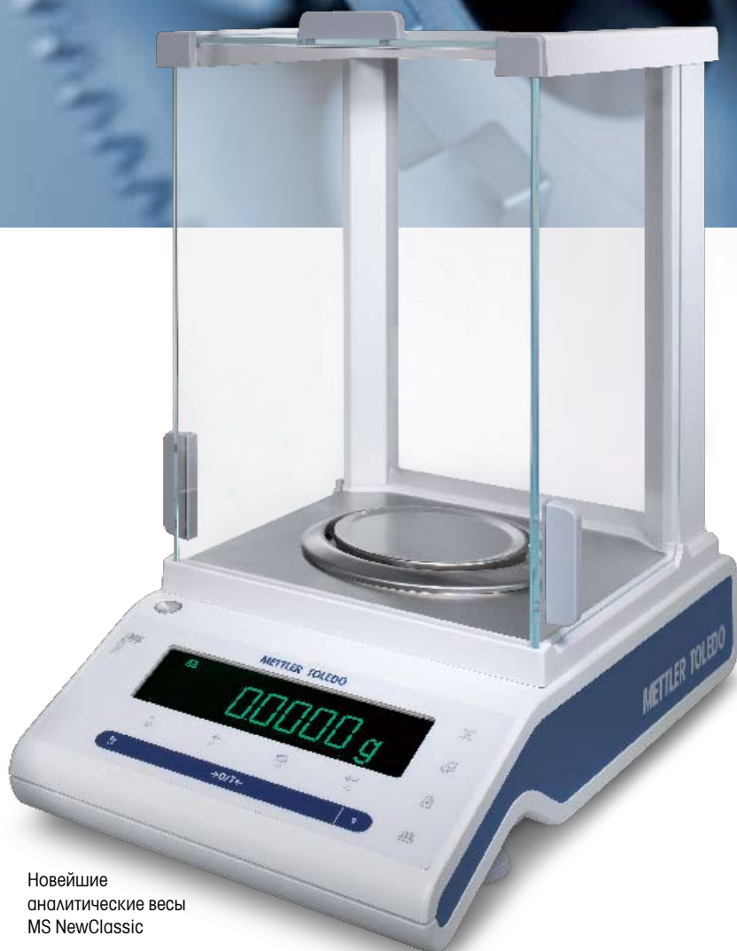
Новейшие аналитические весы MS NewClassic