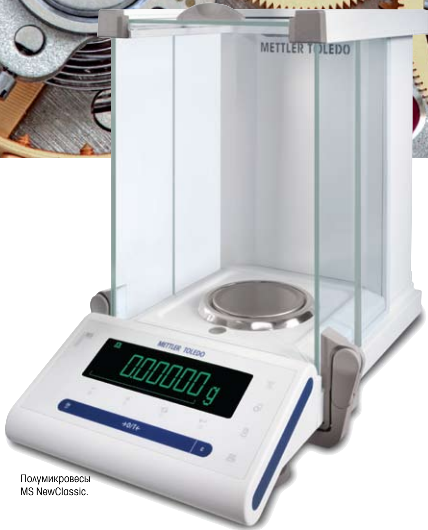
Полумикровесы MS NewClassic.